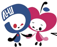
モーリーとリンリン®

青森県立保健大学による、「ヘルスリテラシー推進事業」。 マスコットキャラクターのモーリーとリンリンも、興味津々の ようです。