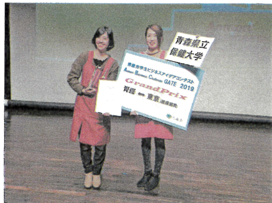
青森市ビジネスアイデアコンテストで グランプリ受賞！ [2月]