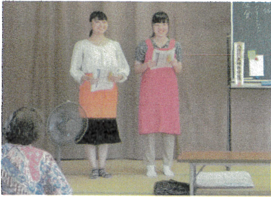
地域住民を対象とした講話の様子 [9月]