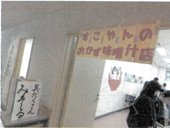
毎年恒例 大学祭に出店 [10月]