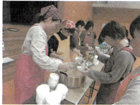
おかず味噌汁提供の様子 [11月]