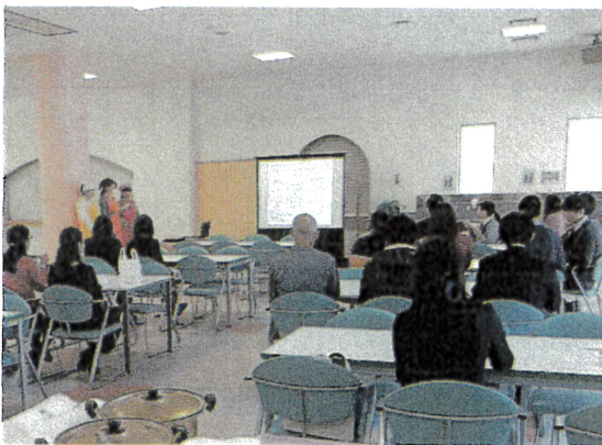
職員研修会の様子 [2月]