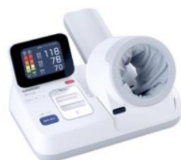
血圧測定・四肢血圧測定

血圧などの測定やリズム・ストレッチ体操、足湯やハンドマッサージなどを実施します。小さな子ども達の遊び場もありますよ!大学生との楽しい交流の中で自分のカラダの事、健康に関する事について楽しく学びませんか!