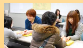
ハンドマッサージ