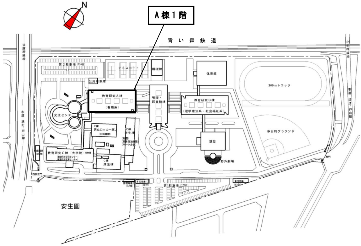
青森県立保健大学 大学構内案内図