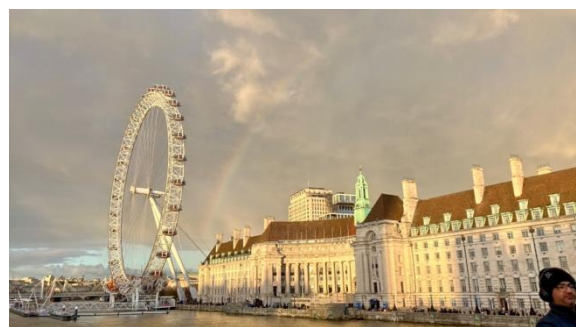
Friends & London 友達とロンドン