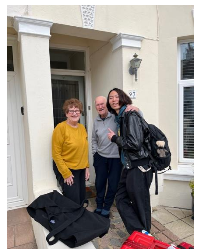
Saying good bye to homestay families お別れの挨拶

The journey back went very smoothly. The flight was long but the students managed to sleep a little. We were tired but glad to be home.