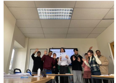
Graduation from ELC 語学学校の卒業