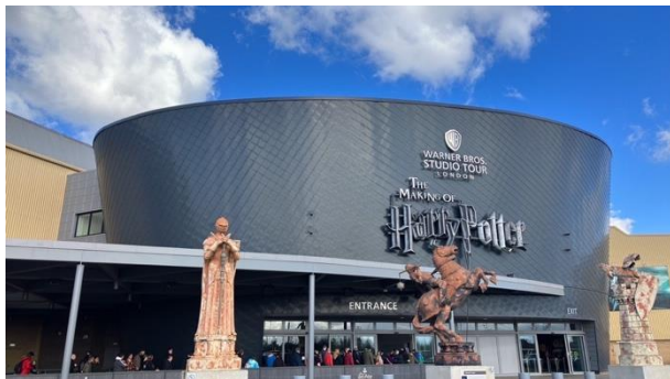
Harry Potter Studio Tour ハリーポッタースタジオツアー